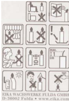
Eine "Gebrauchsanweisung" zur Benützung von Kerzen.